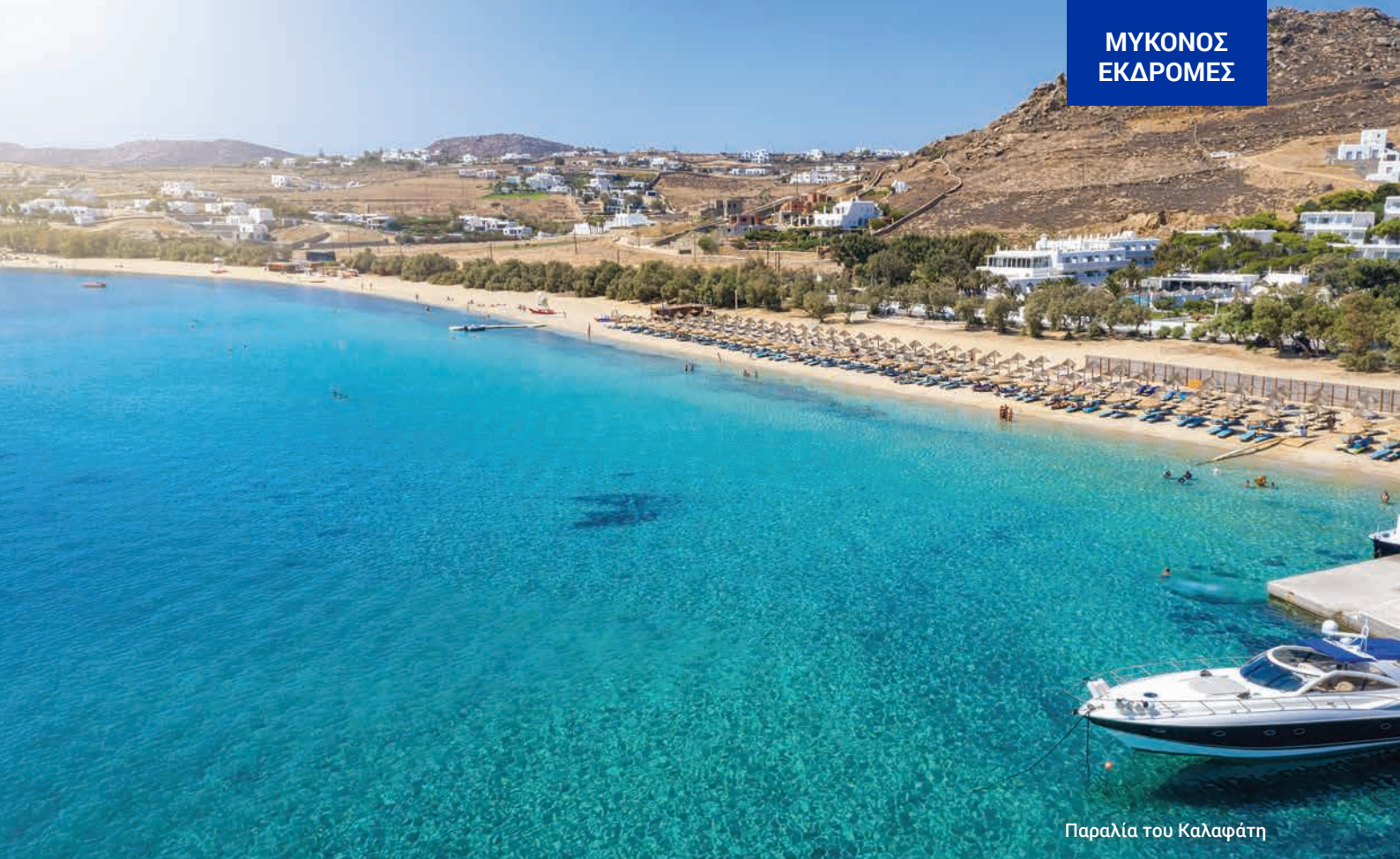
Παραλία του Καλαφάτη