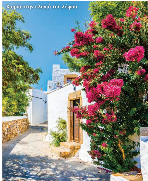
Χωριά στην πλαγιά του λόφου

Ζούμε την εμπειρία του αυθεντικού τρόπου ζωής στην καρδιά της υπαίθρου στην Πάτμο.