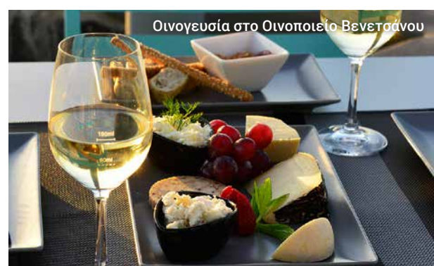
Οινογευσία στο Οινοποιείο Βενετσάνου

Στην πρωτεύουσα Φηρά θα υπάρχει ελεύθερος χρόνος για να κάνετε αγορές και να εξερευνήσετε μόνοι σας πριν επιστρέψετε στο πλοίο έχοντας υπέροχες εικόνες στο μυαλό σας και ίσως στη φωτογραφική μηχανή.