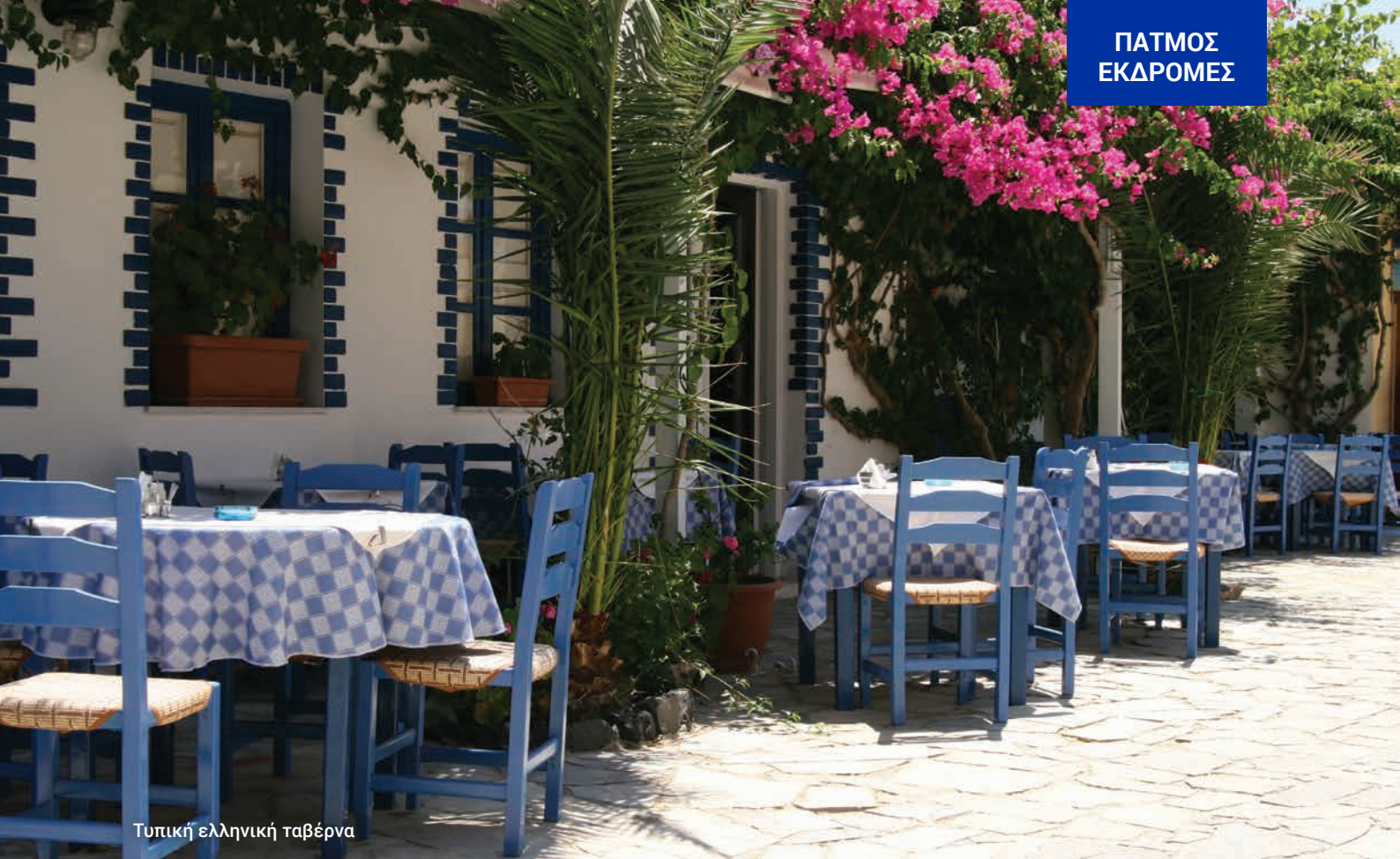
Τυπική ελληνική ταβέρνα