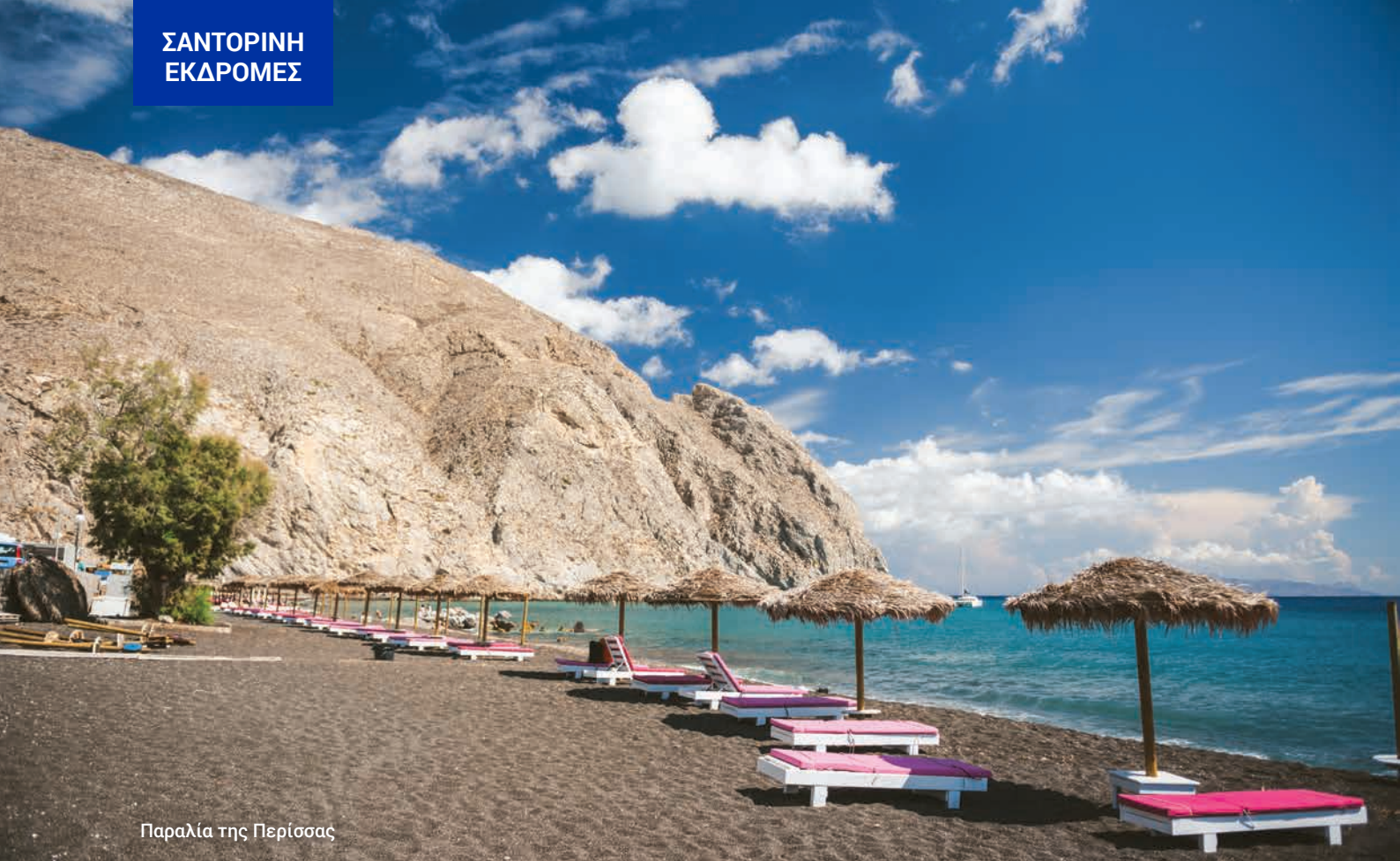
Παραλία της Περίσσης