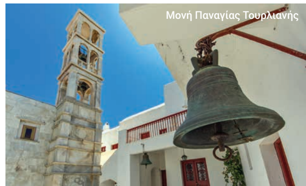
Μονή Παναγίας Τουρλιανής

Η ξενάγηση ενδέχεται να μην είναι διαθέσιμη ορισμένες περιόδους του χρόνου.