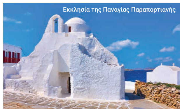
Εκκλησία της Παναγίας Παραπορτιανής