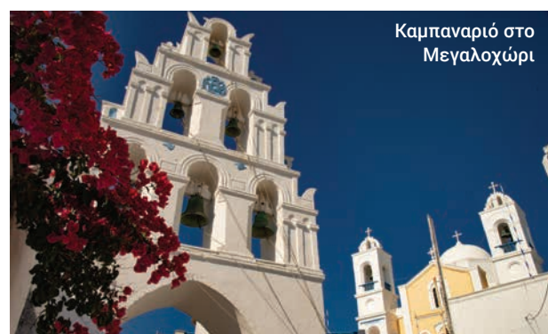
Καμπαριό στο Μεγαλοχώρι