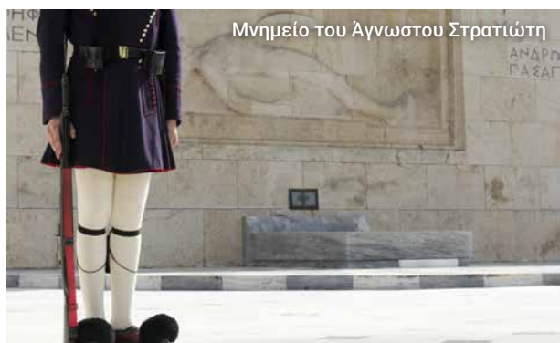
Μνημείο του Άγνωστου Στρατιώτη