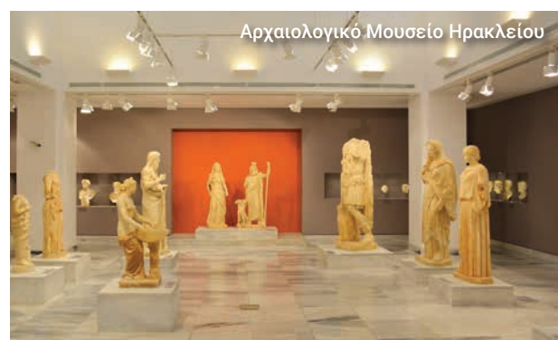
Αρχαιολογικό Μουσείο Ηρακλείου

Στο τέλος, επισκεπτόμαστε το Αρχαιολογικό Μουσείο Ηρακλείου για να μάθουμε περισσότερα για την ιστορία και τον πολιτισμό της Κρήτης.